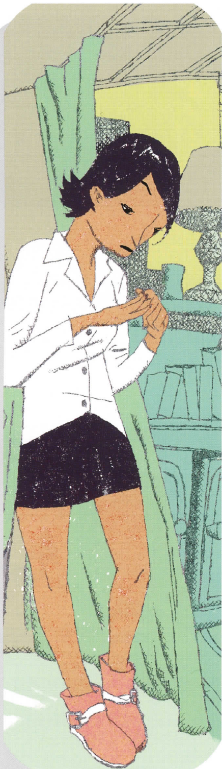
フミオ・オバタ FUMIO OBATA