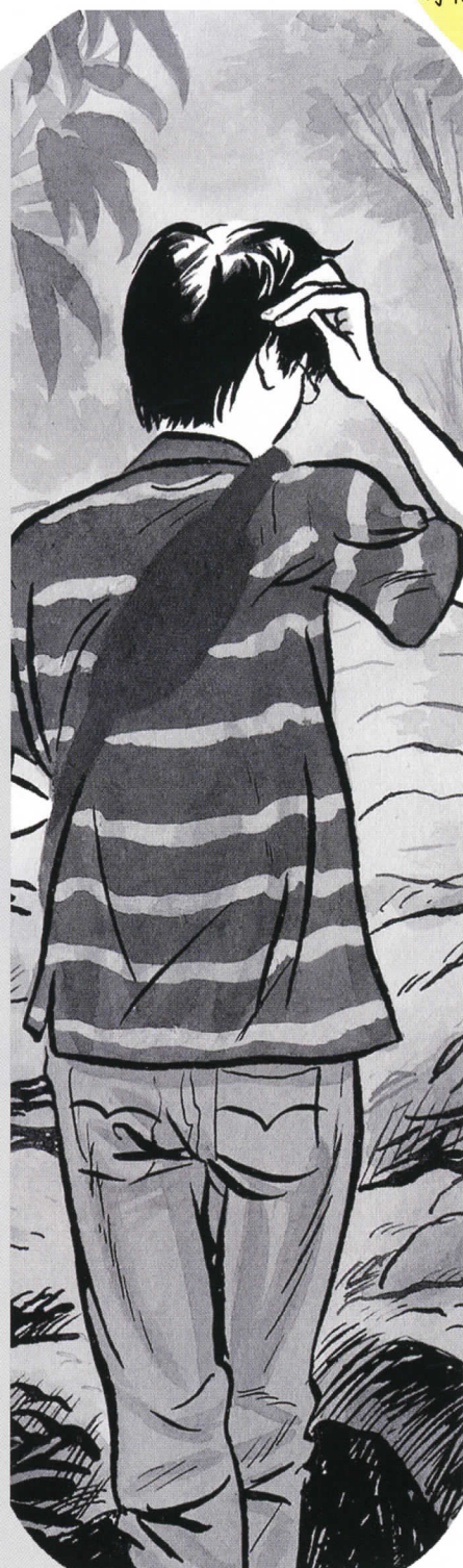
フレディ=ナドルニ・プストシュキン FREDDY NADOLNY POUSTOCHKINE