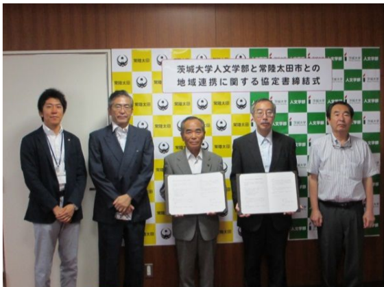
「常陸太田市と地域連携協定を締結」(中央左、常陸太田市市長)

地域連携活動の内容と質を高め持続可能なものにしていくためには、組織的対応を支える学生と教員一人一人の「学習・教育力」、「研究力」、「地域課題解決力」をより一層向上させる必要が不可欠であることを再確認した。