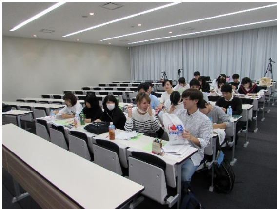
発表前に緊張する古賀ゼミの一团